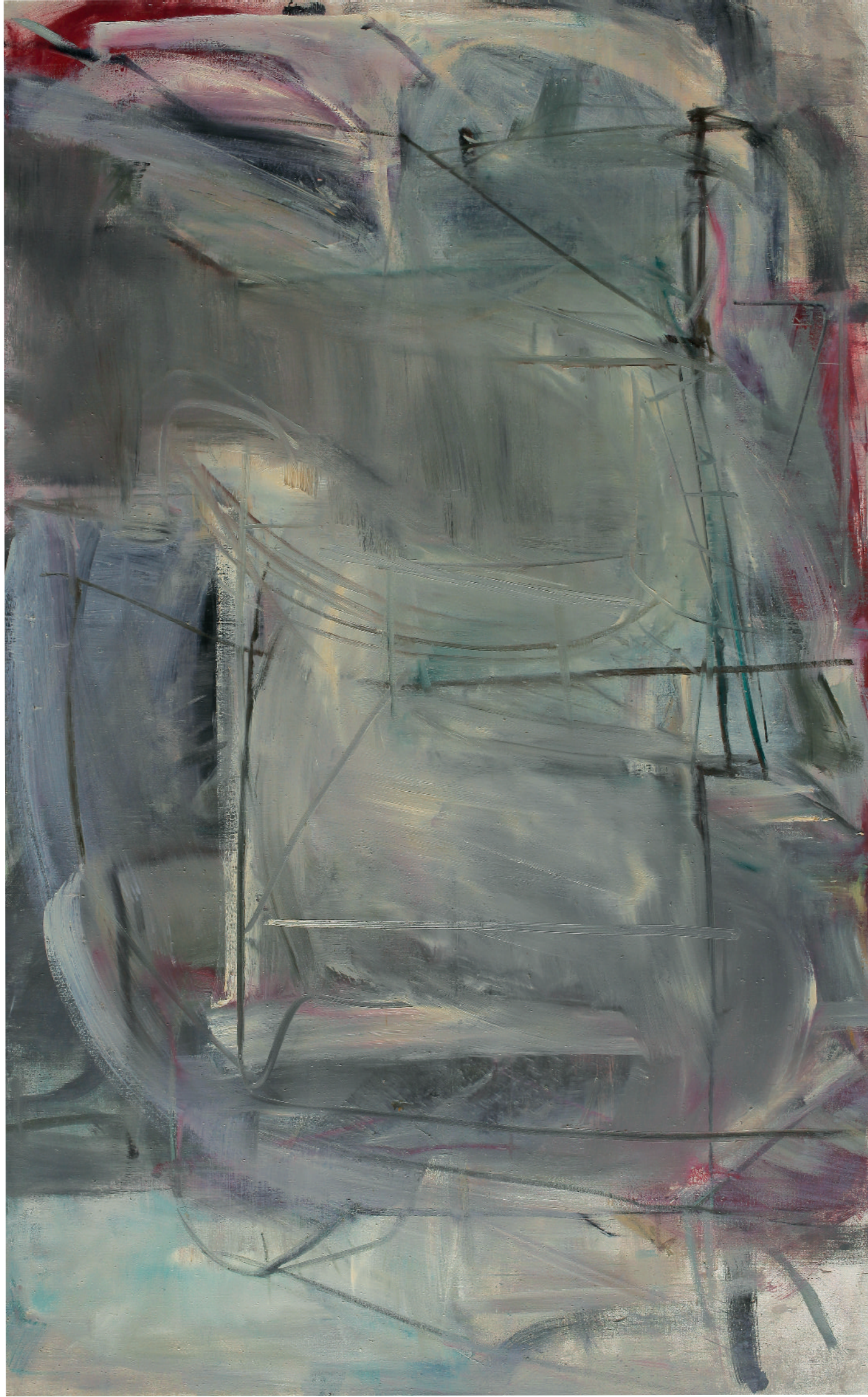
➤ Moshe Kupferman untitled , ca. 1965 Oil on Canvas 130X195cm