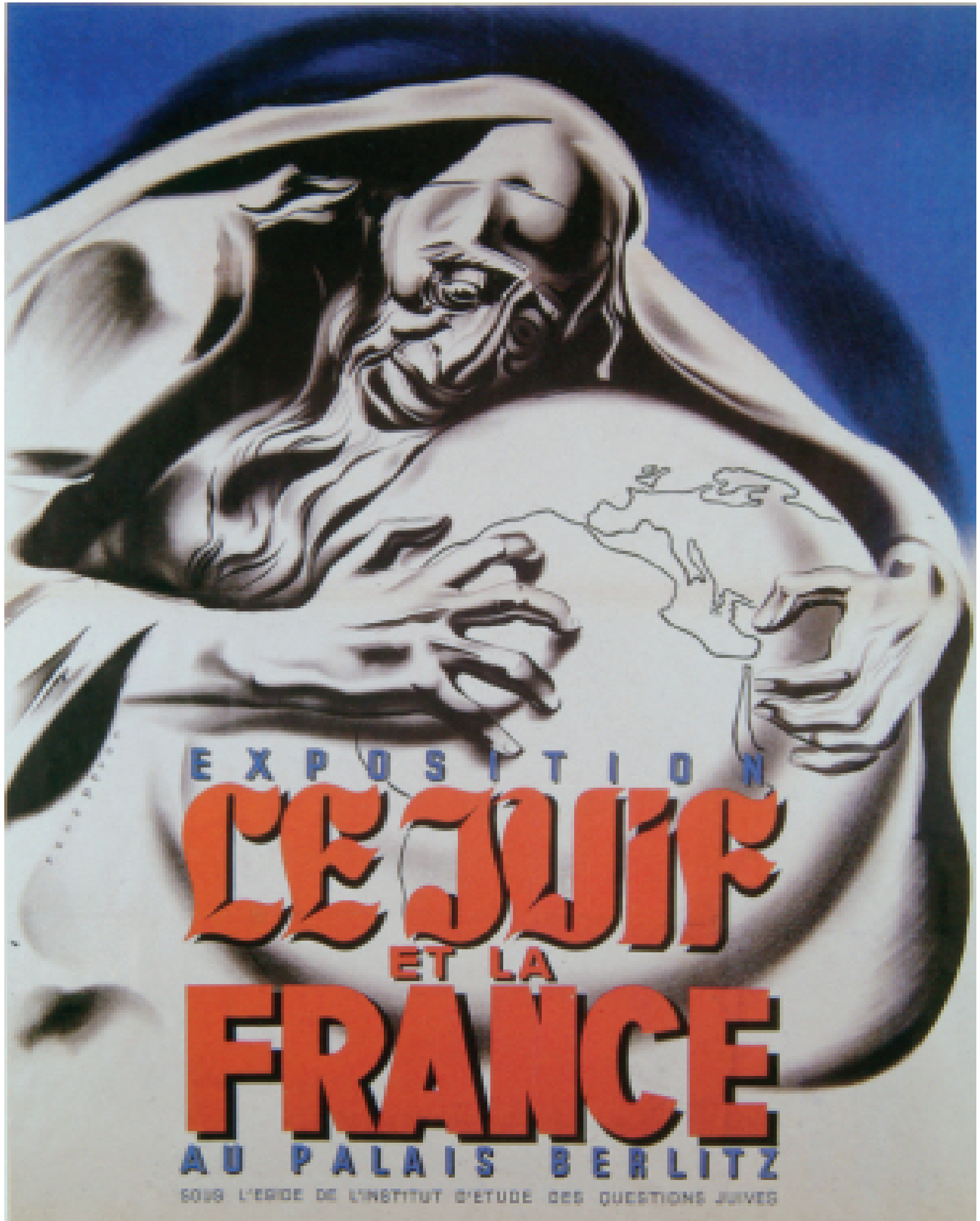
» Affiche de l'exposition Le Juif et la France